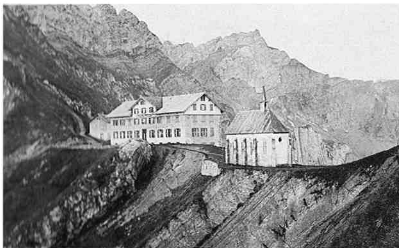
Hotel Klmsenhorn mit Kapelle