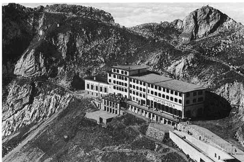
Hotel Kulm, eröffnet 1890